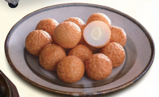
マヨネーズ入りすり身