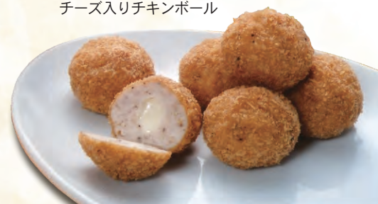
チーズ入りチキンボール