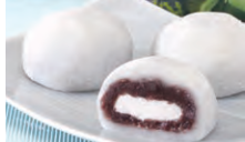
生クリーム入り大福