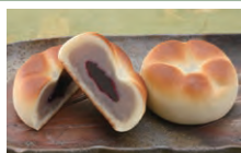
ブルーベリージャム入り乳菓