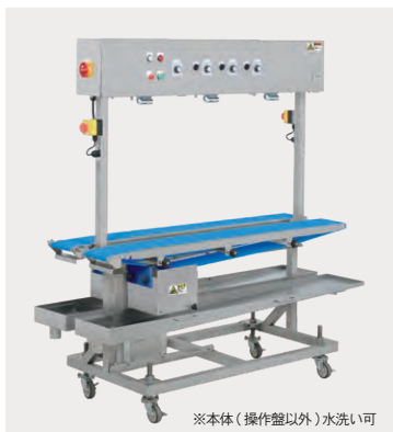
※本体(操作盤以外)水洗い可