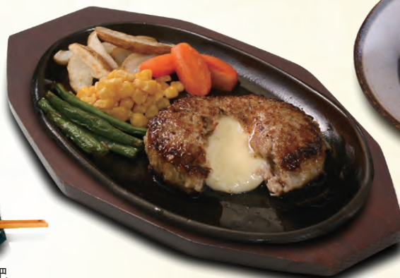
チーズ入りハンバーグ