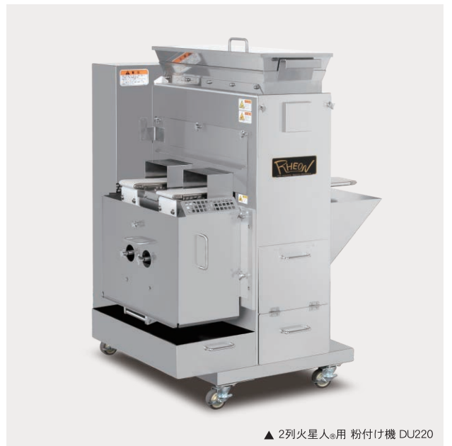
▲ 2列火星人 ® 用 粉付け機 DU220

このカタログに記載されている仕様・外観は改良のため、予告なく変更する場合がありますのでご了承ください。 この内容の一部または全部を無断で複製・転載することは法律で禁じられています。