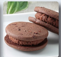
ブラウニーサンド