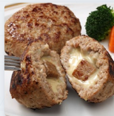
サイコロステーキハンバーグ