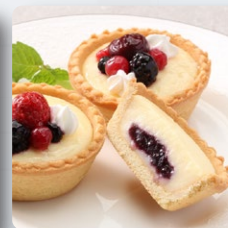
ブルーベリーチーズケーキ