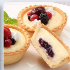
ブルーベリーチーズケーキ