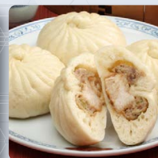
角煮入り中華まん