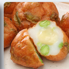
チーズイン枝豆すり身