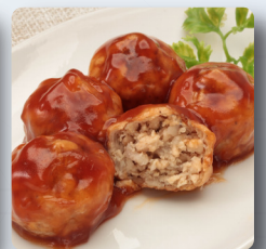
大豆ミートボール