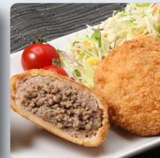
ジューシーメンチ