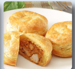
バターチキンカレーパイ