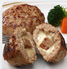
サイコロステーキハンバーグ

火星人®と多彩なオプションを組み合わせることで、製品用途の拡大や生産効率の向上が図れます。