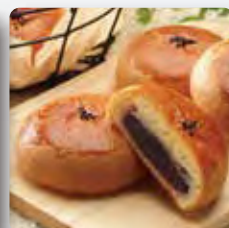
もちもちあんぱん饅頭